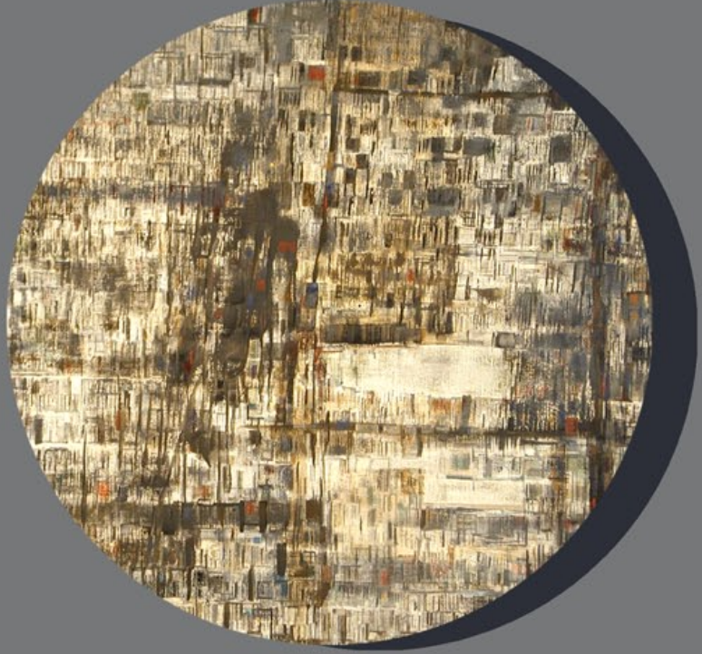
Maria-Hélène Vieira Da Silva, La Montagne magique , 1978,(détail),