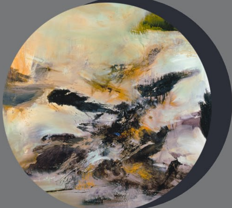
13.9.73,(détail) Zao Wou Ki,

Ces espaces accueillent régulièrement les expositions temporaires organisées par le musée.