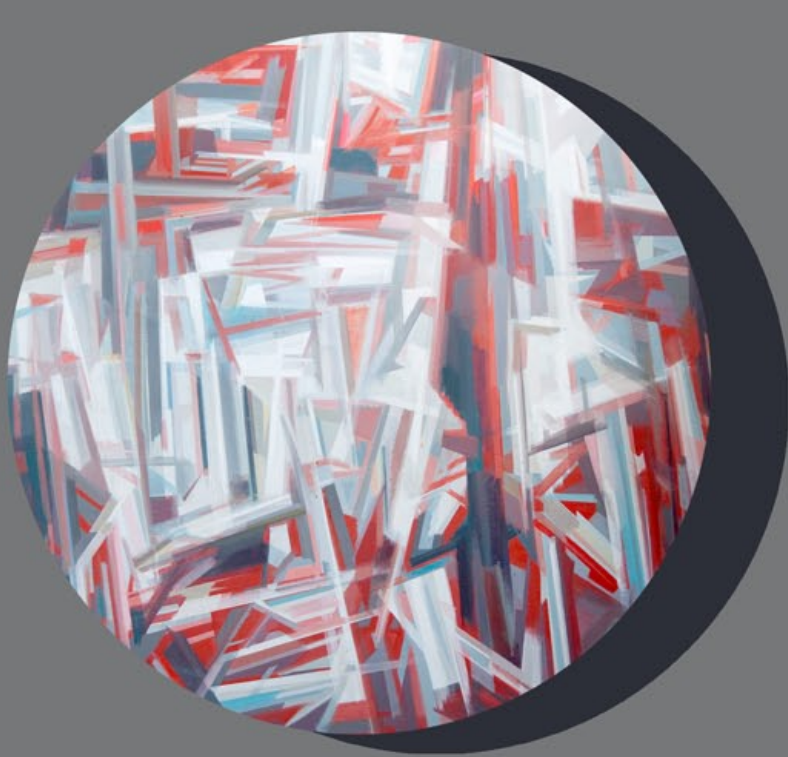
Lucien Lautrec, Montségur , 1978, (détail) .